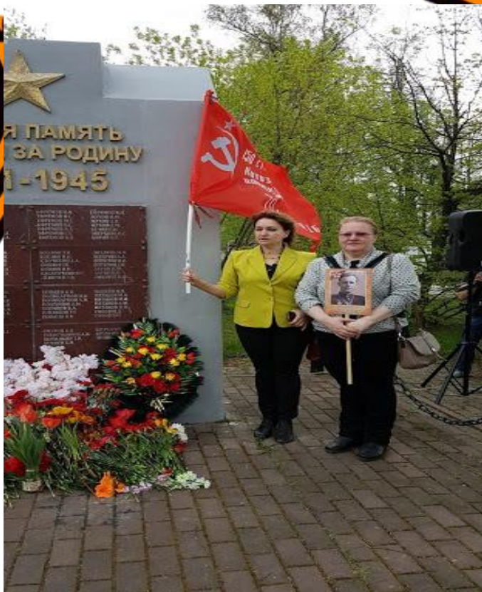
На митинге 9 мая 2019 г. , посвященном Дню Победы